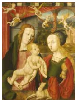
Észak-németalföldi mester: Szent Ágnes eljegyzése (1510–1530)

zékori legendák szerint, csak Alexandriai Szent Katalinnak (i. sz. 287. – i. sz. 305.) és a Rómában élt, nemesi származású szűznek, Ágnesnek (i. sz. 291.– i. sz. 304. jan. 21.) jutott osztályrészül. Ágnes eljegyzését egy németalföldi mester képén látjuk: „Ágnes neve a latin agnus (bárány) szóból ered, így ez lett attribútuma is. Ez a kecses állat itt áhítattal néz fel a gazdájára. A reneszánsz korszak divatos viseletében ábrázolt fiatal leány ujjára a gyermek Jézus húzza fel az aranygyűrűt. A jelenet ünnepélyességét a felettük repkedő zenélő angyal-puttók jelzik. Az esztergomi kép először 2001-ben került a nemzetközi nyilvánosság elé.”