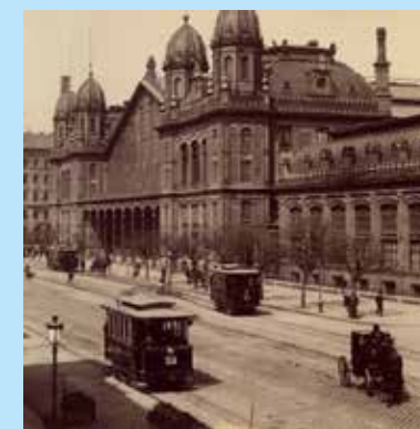
Budapest, Nyugati pályaudvar, 1923