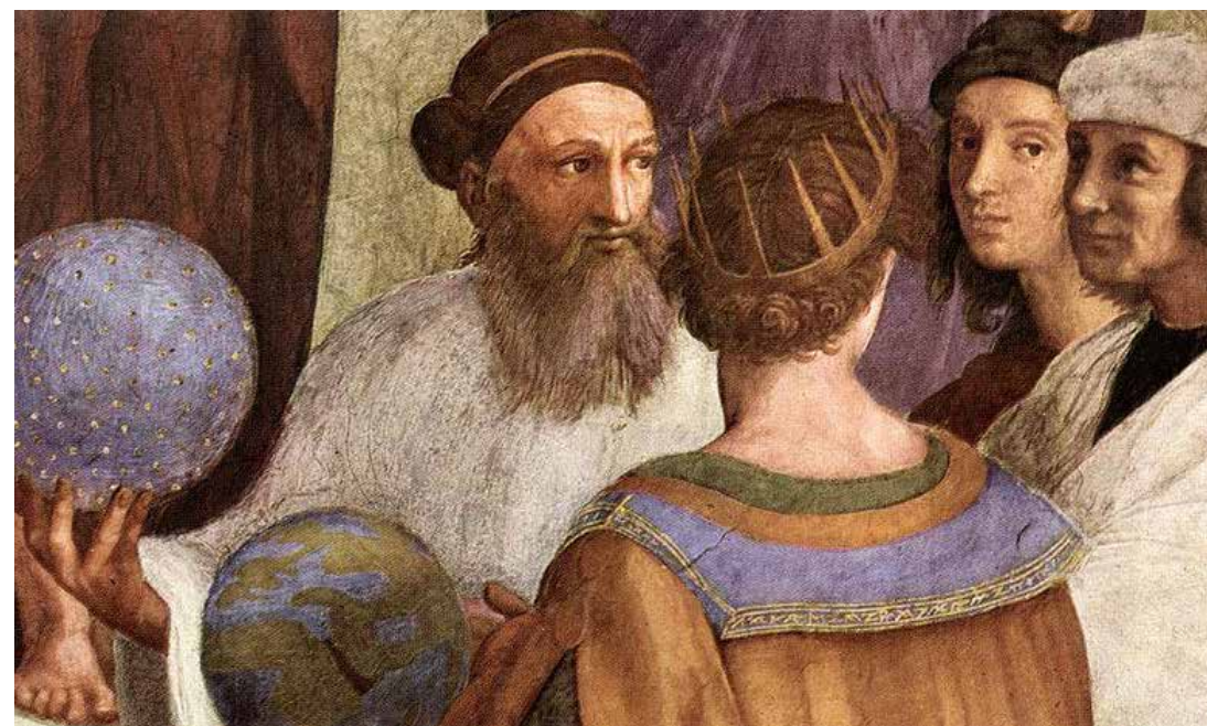
Zarathustra a gömbbel

Egy filozofikus műről van szó, de csodálatos nyelvezete miatt irodalmi műként is szoktak rá tekinteni. A négy könyv a Zarathustra alakjába bújít próféta tanításait foglalja össze. Egyik ilyen tanítása az emberfeletti ember (Übermensch) fogalma, mely elválaszthatatlan a meghalt Isten gondolatától. „Gott ist tot - Isten halott.” És mi emberek öltük meg – írja Nietzsche. Nietzsche művében Isten a viszonyítási pont, az érték forrása, a Rend, az erkölcs. Halálával az ember magára maradt, elveszítette a kereteket. Ha Isten halott, akkor nincs megváltás, nincs gondoskodás, nincs viszonyítási pont. Akkor innentől kezdve az ember maga felelős önmagáért és a világ sorsáért