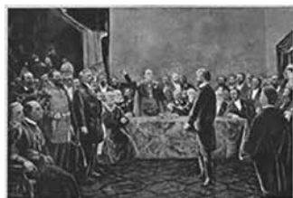
Aggházy Gyula grafikája Munkácsy köszöntéséről

1882. febr. 20-án volt, amikor „a 38. évébe lépő Munkácsy a Képzőművészeti Társulat elnöke, Ipoly Arnold, valamint Trefort Ágost vallás- és közoktatásügyi miniszter üdvözölte és köszöntötte. Az eseményt Aggházy Gyula grafikája örökítette meg, amelyet a Vasárnapi Ujság is közölt. Ezen a találkozón adták át a festőnek az ezüstkoszorút, amelyet művészetének elismeréséül készítettek...” Munkácsy, aki febr. 18-án érkezett meg feleségével, hatalmas tömeg fogadta, fáklyás felvonulást, álarcosbált rendeztek tiszteletére, a Krisztus Pilátus előtt c. alkotását, mely febr. 17-én, hatalmas ládába csomagolva érkezett a fővárosba, a Múcsarnokban állították ki.