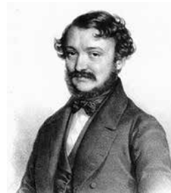
Barabás Miklós: Erkel Ferenc (litográfia, 1845)

ni. Az első, mai értelemben vett magyar opera Ruzitska József (kb. 1775–1883) Béla futása c. műve volt, melyet 1822-ben mutatnak be. Az első magyar vígopera (A csel, 1839) komponistája Bartay András (1799–1854) volt.”