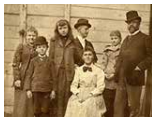
Romhányi (nőgrádi) menyasszony

*Menyasszonybúcsúztatóra népdalok. Az esküvő napján, anno, a lánypajtások, a „komák” és a család dallal/szokásjátékkal búcsúztatta el a menyasszonyt, még a szülői házban. „Jaj, pártám, jaj, pártám, Gyöngyösi koszorúm, Gyöngyösi koszorú, Gyöngyvel rakott pártám!” E szavakkal kezdte a búcsúztatót a nőgrádi menyasszony lánypajtásaitól, majd a dal végén az anya szól, biztatón, lányához: „Ne félj, lányom, Náni lányom, /Véled leszen a nagy Isten,/ Véled leszen a nagy Isten, /Isten után Okosi István.”