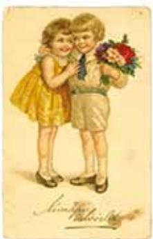
Névnap üdvözlő 1936-ból

*Névnapra? Képeslap! Régebben szokás volt a gyermeknek azt a nevet adni, melyet születése napján vagy pár nappal később, keresztelések a naptár épp mutatott – névnapra pedig szokás volt/lett képeslapot küldeni, de csak az 1800-as évek végétől. A magyar képeslap-történet ugyanis 1896-ban, a millenniumi sorozattal indult, de hamarosan a születésnap, névnap, karácsonyi, húsvéti, pünkösdi és üdülési témájú üdvözlőlapok lettek a legnépszerűbbek, melyeken a családtagok, barátok eljuttatták üdvözlőiket egymásnak.