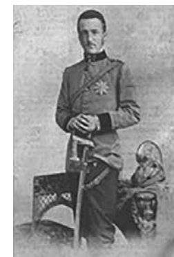
Az ifjú József főherceg fényképe a Vasárnapi Ujság 1896/28-as számában

ből való gyakorló is, számosan voltak a' rendes muzsikuskon kívül, eszközök, Haydn Úr igyekezetének, a' telyes meg-elégedésig való végre-hajtásában.”