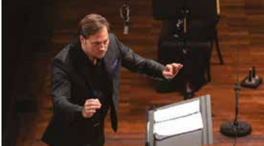
A pulpitus másik oldalán

bjz A zenekar 25 éves évfordulója alkalmából minden zenésztől készült egy kis névjegy-interjú. Abban az alábbiakat mondod, de érdekelne a mostani véleményed is erről: „Remélem, még sokáig muzsikálhatok együtt ezzel a nagyszerű csapattal, és kívánom, hogy még