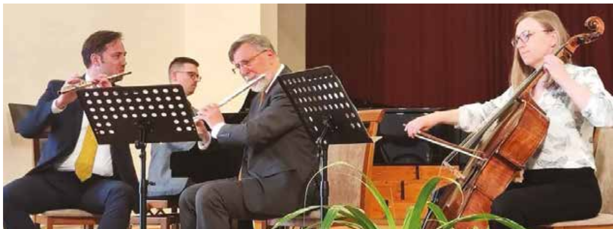
Örömmel családi körben

fejezőerő az, amitől valami értékes lesz számomra. Nem elég szépen játszani. Ezer olyan előadót hallok nap mint nap, aki hibátlanul eljátssza a hangokat egy műben, de az a plusz hiányzik belőle, amitől izgalmas, megindító vagy éppen katartikus lesz az előadás. Szerencsére a BDZ-ben az elmúlt 20 évben számtalanszor megélhettem a katarzis élményét koncerteken, melyet nem cserélnék el semmiért. Nekem zenészként ez adja a legtöbbet: a zenekari hangzásvilágban létezni, ahol csontomig hatol a zene. De ehhez az együtt lélegzéshez mindenkire szükség van a zenekarban - a karmesterről ne is beszéljünk -, hiszen egy a cél, egy az út. Ebben rejlik többek között a közösség ereje, és ezen a területen a Budafoki Dohnányi Zenekar kimagaslóan teljesít.