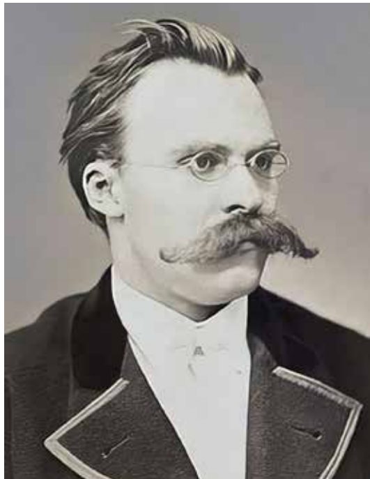
Friedrich Nietzsche német filológus

Strauss Imígyen szóla Zarathustra című szimfonikus költeményébe ültette mindazt, amit a nietzschei mű olvasásakor benyomásként elraktározott. Ekkorra már túl volt jó néhány szimfonikus költeményen, melyek ihletője mind egy személyes élmény volt. Ez volt az első a szimfonikus költeményei sorában, mely nem a saját élményeit, hanem a Nietzsche műve olvasásakor támadt érzéseit fejezte ki. A művet 1896-ban mutatták be a szerző vezényletével, ám fogadtatása