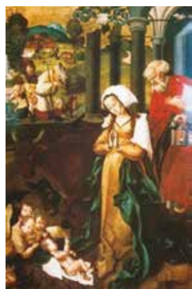
M. S. mester: Jézus születése