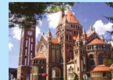
A szegedi Fogadalmi templom