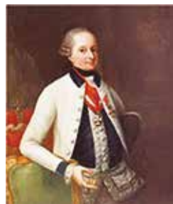
Eszterházy Miklós herceg

Miklós-misét először 1772 adventjén, dec. 6-án mutatták be. A Miklós-napi előadáson minden bizonnyal a herceg (1714. dec. 18. – 1790. szept. 28.) névnapjáról is megemlékeztek.”