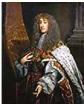
Az ifjú XIV. Lajos (1661)

*Királyok születésnapjára dal és óda. „1659. szeptember 10-én született Henry Purcell, az egyik legjelentősebb barokk zeneszerző. Állítólag már kilencévesen komponált, de első datált műve, a XIV. Lajos, a napkirály (1638. szept. 5. – 1715. szept. 1.) születésnapjára 1670-ben írt óda – a szerző 11 éves. Tagja a Chapel Royal gyermekkórusának, 14 éves korától királyi hangszerkészítő és -javító, 1677-től a »királyi hegedűsök házi zeneszerzője«, két évvel később a Westminster-apátság organistája, 1682-től királyi organista, 1683-tól udvari zeneszerző. 1685-87-es időszakát fémjelzi még a II. Jakab (1633. okt. 14. – 1701. szept. 16.) születésnapjára írt három óda.”